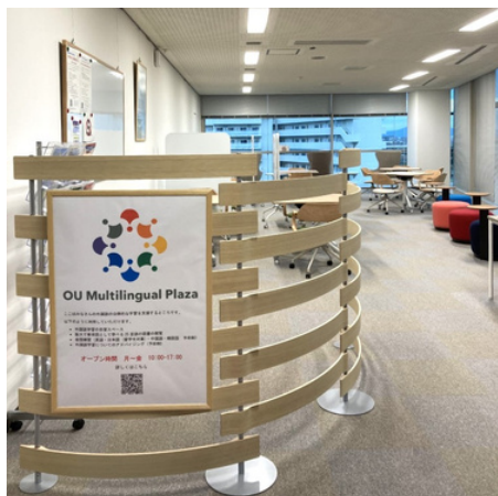
豊中キャンパス D3センター 4階 (旧サイバーメディアセンター)