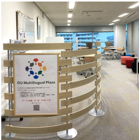
豊中キャンパス サイバーメディアセンター 豊中教育研究棟 4F 開室時間：月～金 10:00-15:00