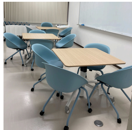
吹田キャンパス ICホール2階(Room4) 開室時間：金 12:00-13:30